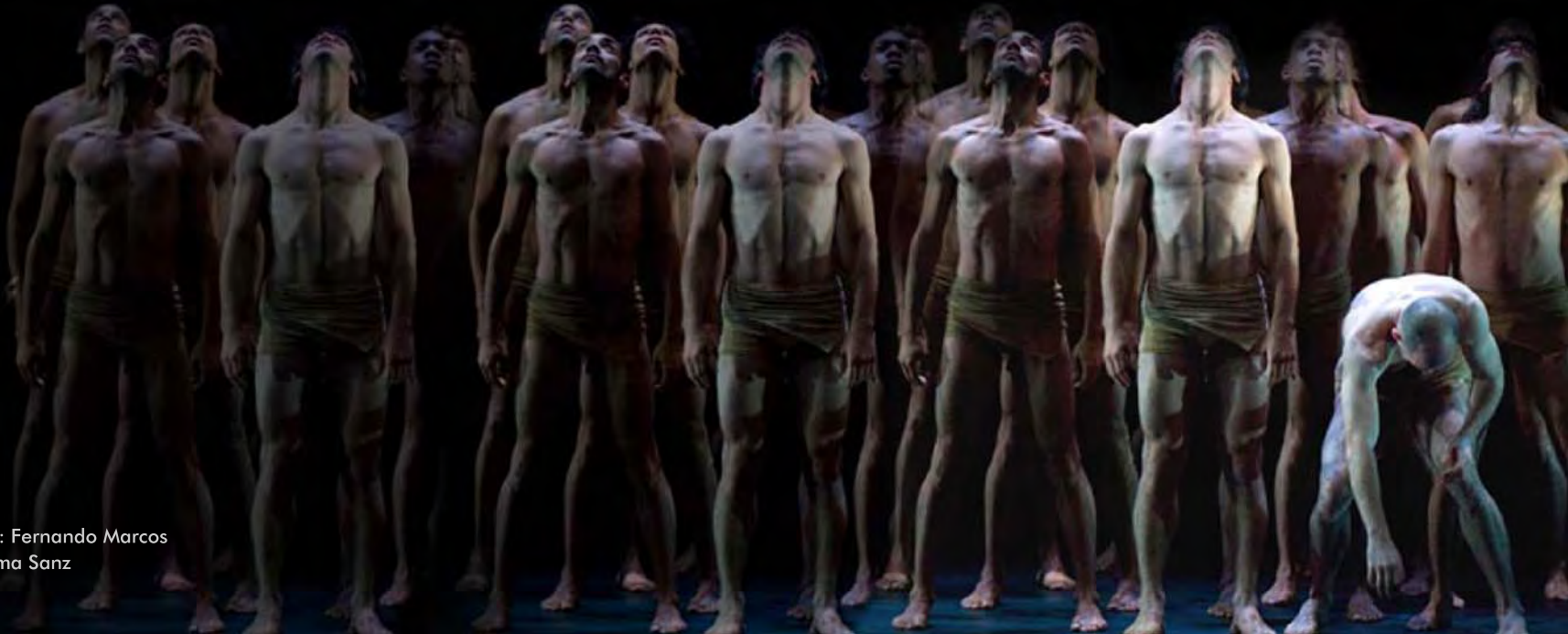
Fotografías: Fernando Marcos Texto: Paloma Sanz

Nos presenta a un Duato más oscurecido, más reflexivo e intimista ante un escenario y una escenografía austeros. La obra comienza con luz y una disposición simétrica prometedoras, pero, a medida que la obra avanza va perdiendo pulso, músculo, se vuelve densa, dando la sensación de que sobra algo... tiempo, quizás. Resulta un poco largo y el intento final de recuperar el pulso inicial no es suficiente. Lo mejor, como siempre que se habla de la Compañía Nacional de Danza, son sus bailarines. Brillantes, siempre fluidos en sus movimientos. Tanto individualmente como en los hermosos momentos en los que se agrupaban. En cualquier caso, una auténtica delicia.