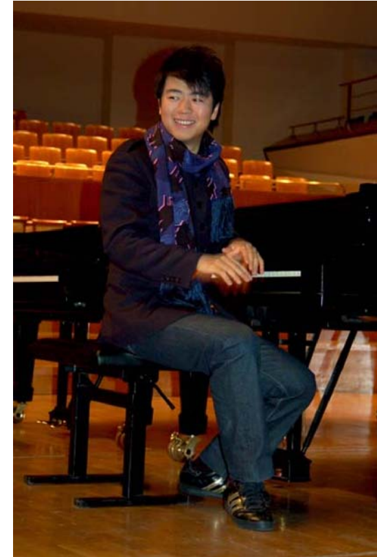
Lang Lang durante la rueda de prensa en el Auditorio Nacional en Madrid